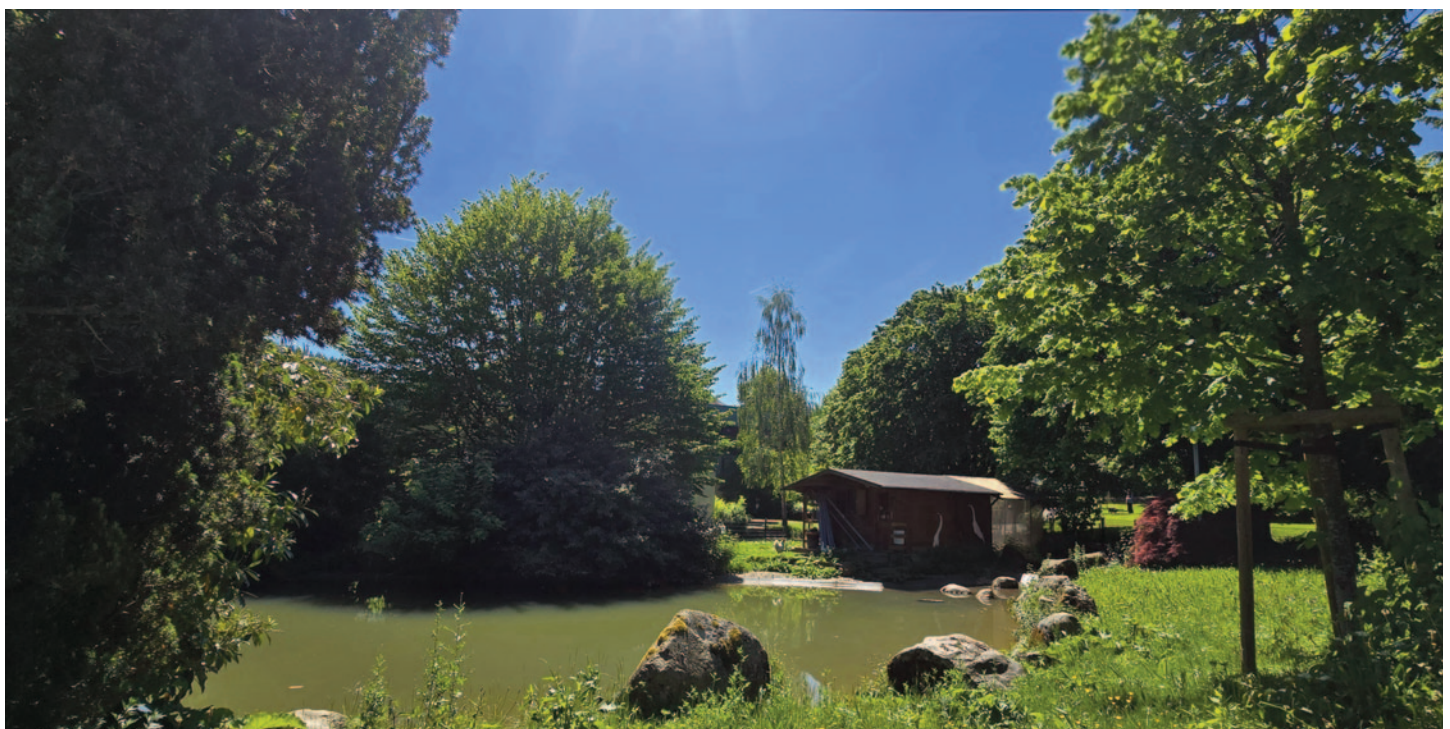
Teichanlage in Merzhausen.